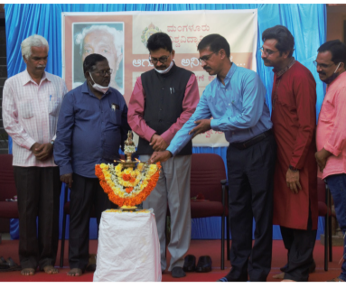
ಮಾತಾನ್ಮಾಡುತ್ತಾ ಕುವೆಂಪು ಅವರು ಹೆಚ್ಚಿಟ್ಟು ಜ್ಞಾನ ದೀಪ್ತಿಯ ಬೆಳಕೆಲ್ಲ ಎಲ್ಲಾ ವಿದ್ಯಾರ್ಥಿಗಳೂ, ಯುವಕರು ತಮ್ಮ ಜಿಂತನೆಯ ಹರವನ್ನು ವಿಸ್ತರಿಸಿಕೊಳ್ಳ ಬೇಕು ಎಂದು ತಿಳಿಸಿದರು.